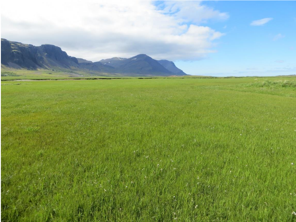
1. Mynd. Gulstararengi (flæðiengi) á bakka Andakílsár, neðan Ausu.