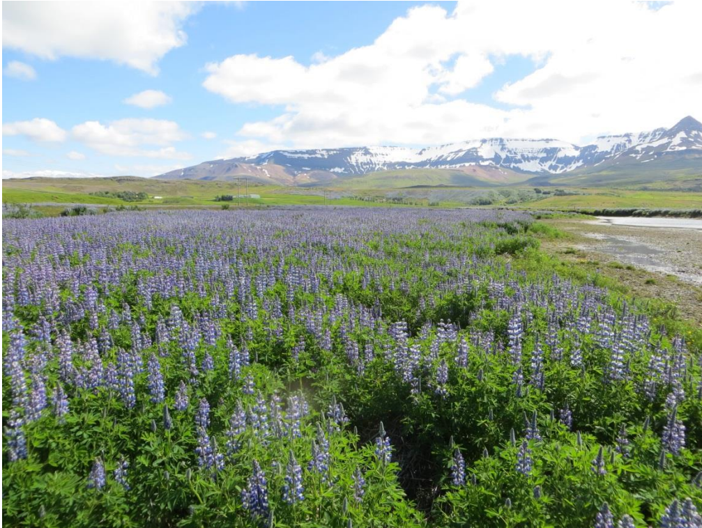
9. Mynd. Lúpínubreiða á eyri í Andakílsá ofan brúar. Lúpína bindur möl og hefur áhrif á farveg og umrót botnsets í ánni.