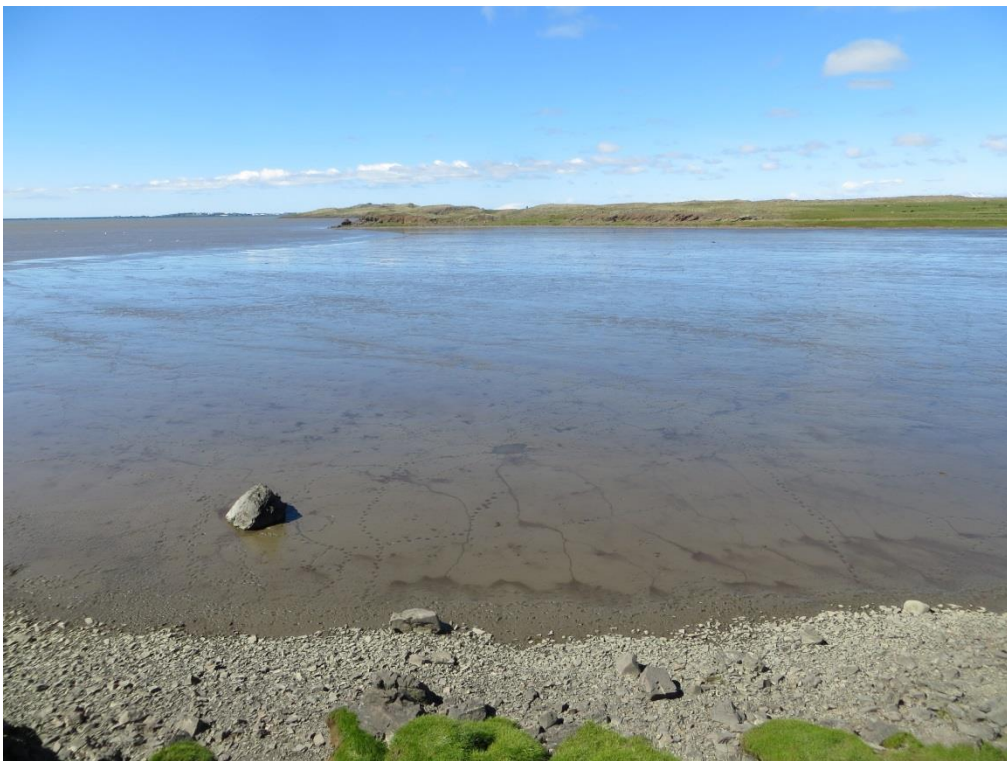
8. Mynd. Leirur í Kistufirði, séð út til Kistuhöfða.