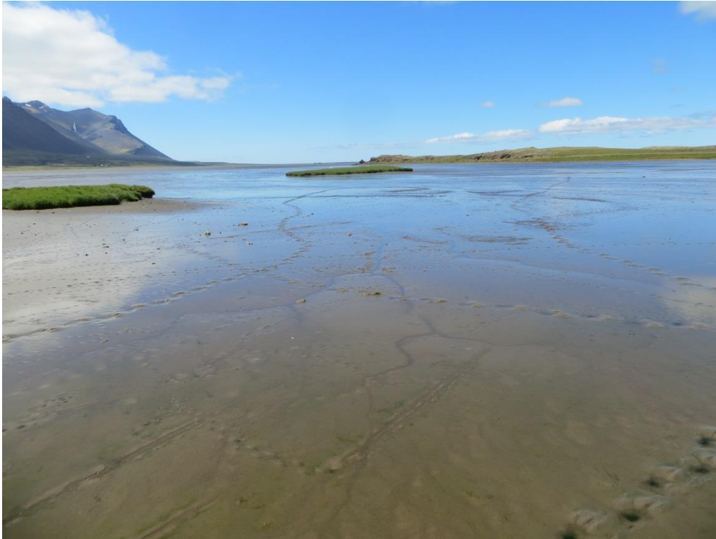
7. Mynd. Leirur í Kistufirði, lítt raskaðar að sjá.