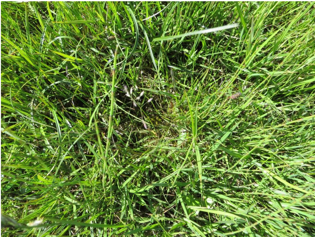
2. Mynd. Svörður í gulstararengi neðan Ausu, ekki voru þar merki um set frá inntakslóni.