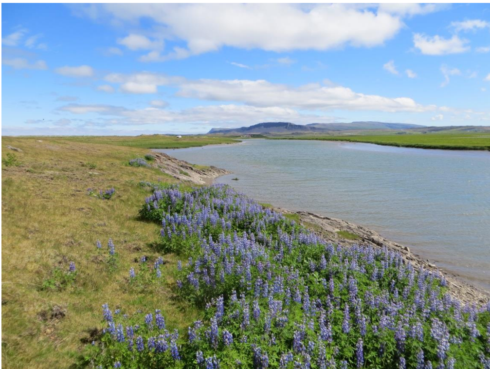
10. Mynd. Breiða af alaskalúpínu í friðlandinu við Andakílsá, í landi Hvanneyrar. Líklegt er að fræ hafi dreifst með ánni frá svæðum upp með ánni.